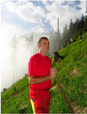
Hüttschlag im November 2024

für ein stilles Gebet, für eine stumme Umarmung, für ein tröstendes Wort, gesprochen oder geschrieben, für einen Händedruck, wenn die Worte fehlten, für alle Zeichen der Liebe und Freundschaft, für Blumen, Kränze und Kerzen.